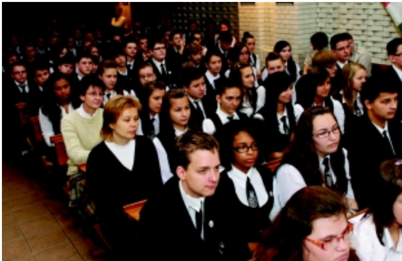
Az ünnepi misét hallgatják a tanulók